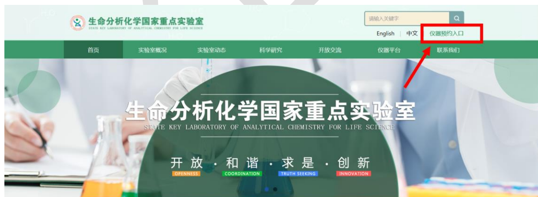
图 1 登陆预约窗口