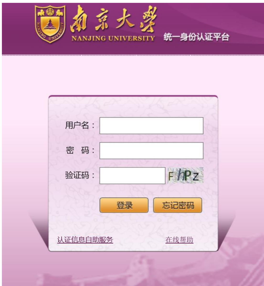
图 2 统一身份认证平台